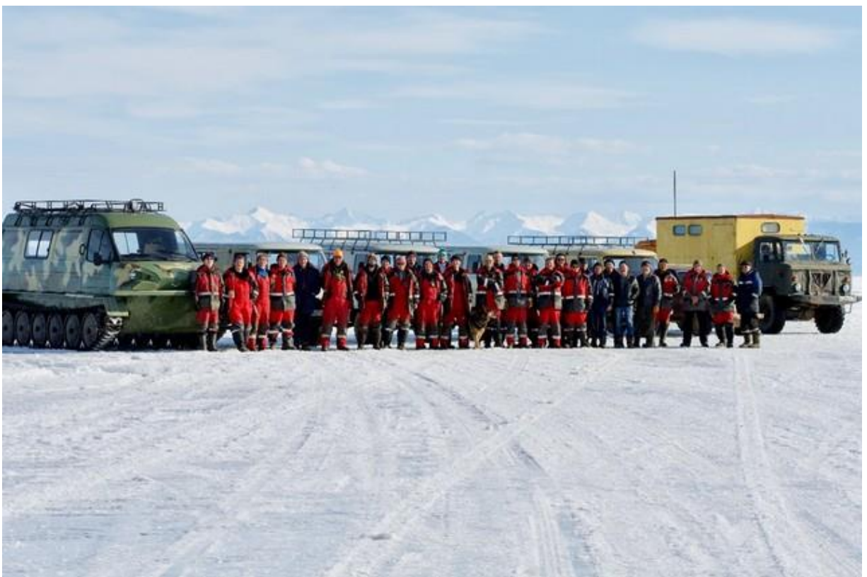
Последняя фотография перед уходом со льда. Экспедиция 2019 завершена