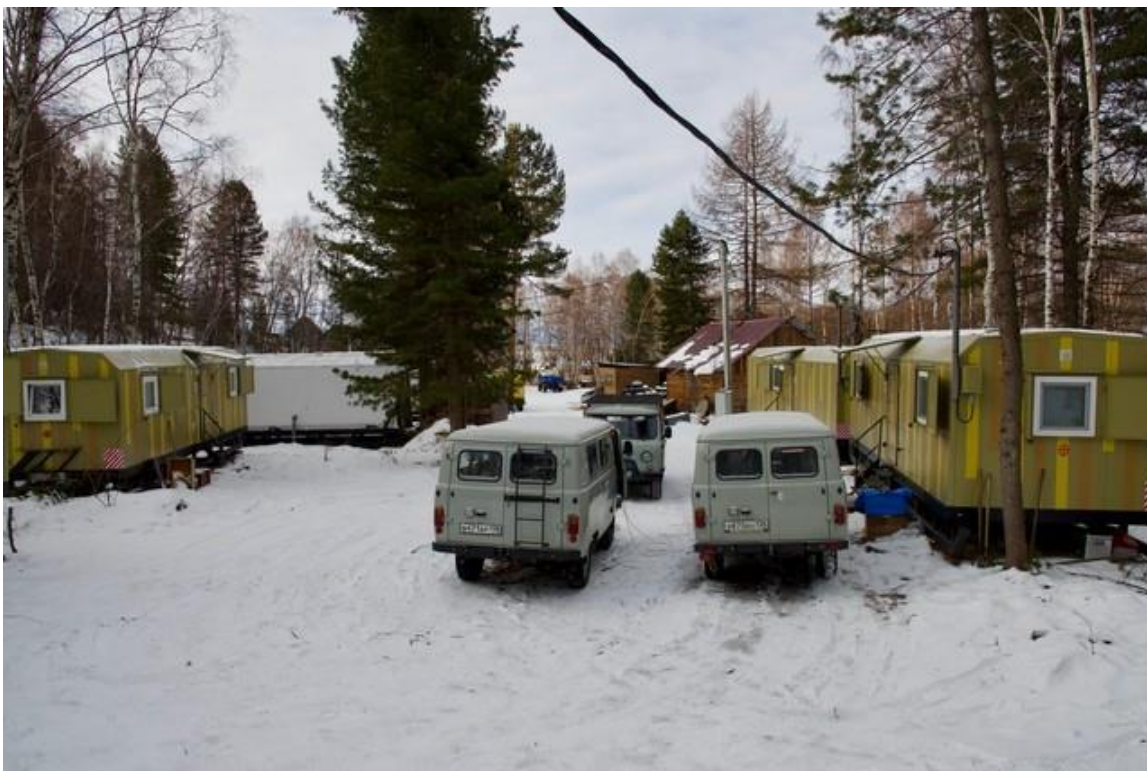
Новые вагон-дома с каютами для индивидуального проживания и новый автотранспорт для транспортировки персонала по льду озера Байкал