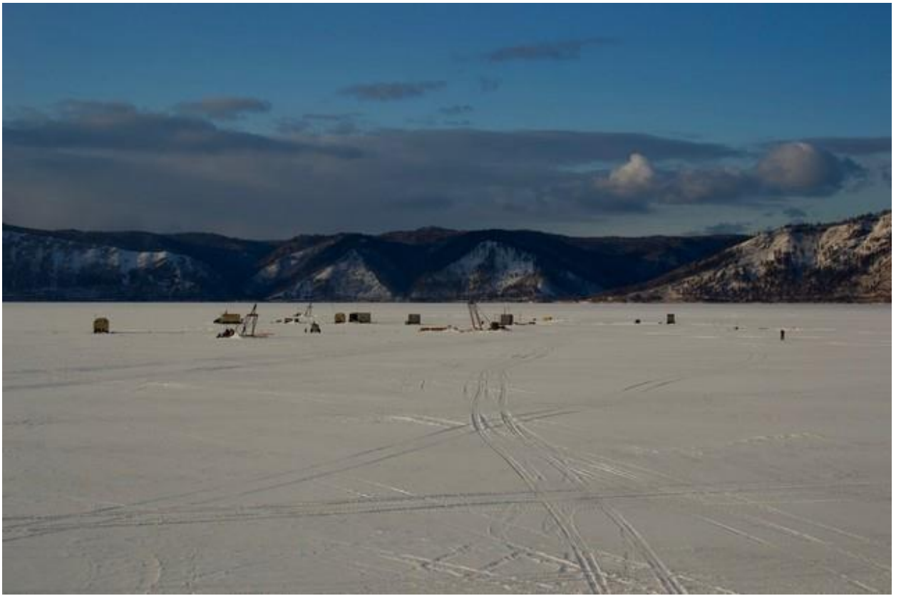
Вид части ледового лагеря в хорошую погоду