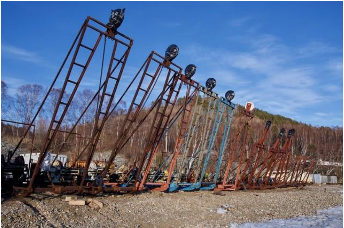
Лебедки – основной инструмент для выполнения глубоководных монтажных работ с поверхности льда