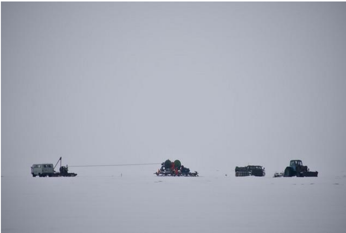
Прокладка донного опто-электрического кабеля от кластера до Берегового центра – 6 км