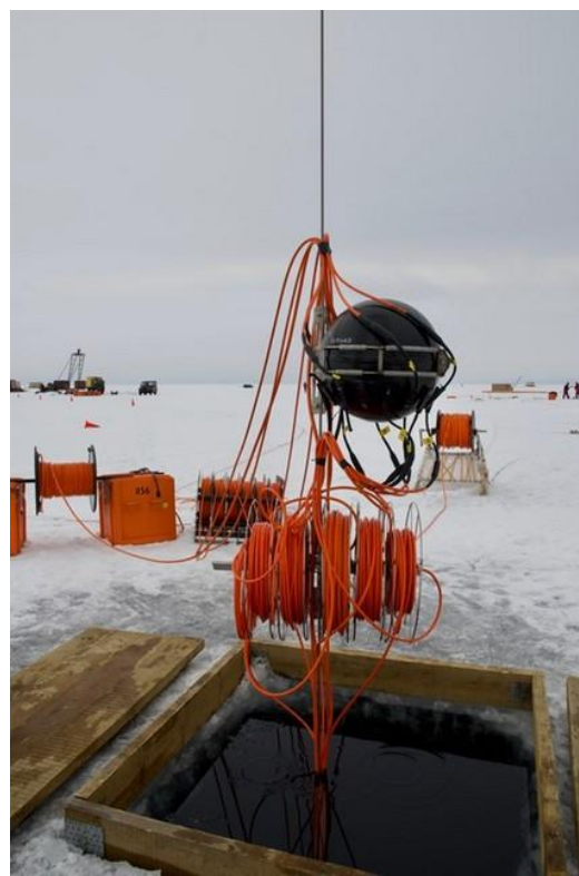
Центральный модуль секции