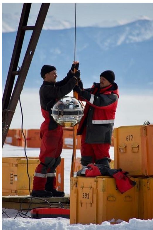
Очередной оптический модуль подготовлен к погружению