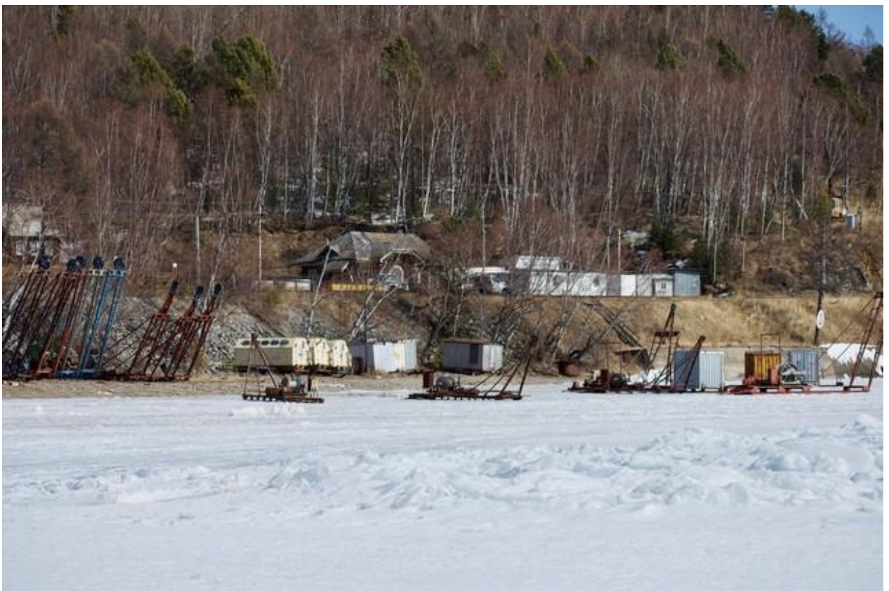
Вид на береговой центр со стороны Байкала