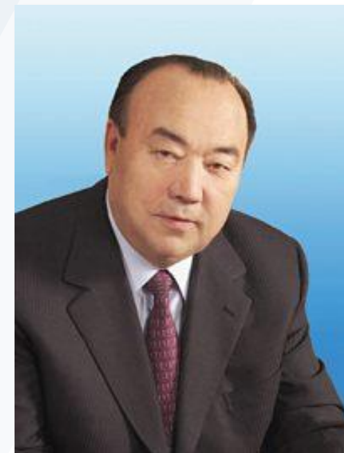
Рахимов Муртаза Губайдуллович (Президент РБ с 1993 по 2010 гг.)

В состав академии вошли ведущие ученые Башкирского научного центра Уральского отделения Академии наук СССР, отраслевых институтов, которые функционировали в республике с 1951 года.