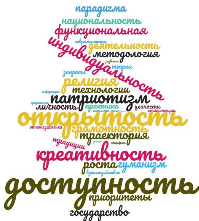
Рис. 1. Методологические условия и принципы поликультурного образования

Анализ фундаментальных основ поликультурного образования требует обратить внимание на этносоциальный, культурологический, аксиологический, потребностный аспекты, которые способствуют формированию ценностей на уровне: