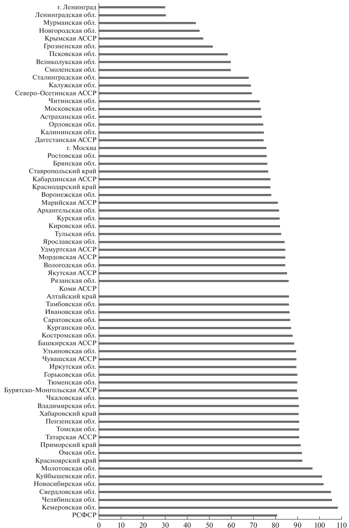
Рис. 1. Всё население РСФСР в 1945/1941 гг., %