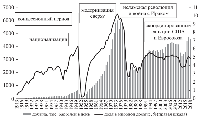
Рис. 1. Динамика нефтедобычи в Иране: объём (тыс. барр. в день) и доля в мировой добыче (%)

Иран занимал четвёртое место в мире после Венесуэлы, Саудовской Аравии и Канады [1], а издержки её добычи, как и в Саудовской Аравии, самые низкие в мире [2]. Выгодное географическое положение в принципе позволяет поддерживать масштабный нефтяной экспорт на все основные мировые рынки. При этом динамика нефтедобычи имеет ярко выраженный циклический характер, что обусловлено экзогенными политическими факторами.