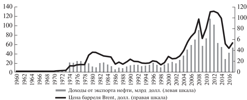
Рис. 2. Динамика цены Brent (долл./барр.) и доходов Ирана от экспорта нефти (млрд долл.) Источники: [1, 3, 15].

тракт обратного выкупа заключила американская ConocoPhillips , однако санкционный режим запрещал инвестиции в иранский нефтегазовый сектор, поэтому контракт был аннулирован. Сменившая ConocoPhillips французская Total получила на это разрешение от США, что открыло иранский нефтегазовый сектор для европейских компаний, включая Royal Dutch Shell , Elf и AGIP [9, 13].