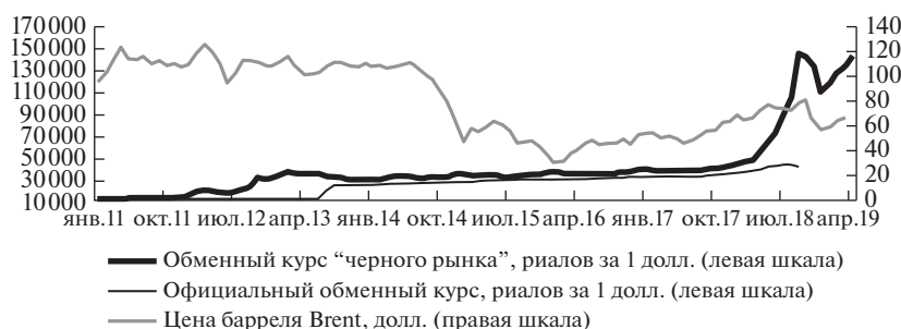
Рис. 5. Иран: ежемесячная динамика обменных курсов национальной валюты и цены нефти Brent, январь 2011 — апрель 2019 гг.

Источники: рассчитано по [49] и данным отраслевой бизнес-периодики.