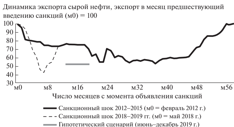
Рис. 4. Глубина снижения экспорта иранской нефти в период двух санкционных шоков