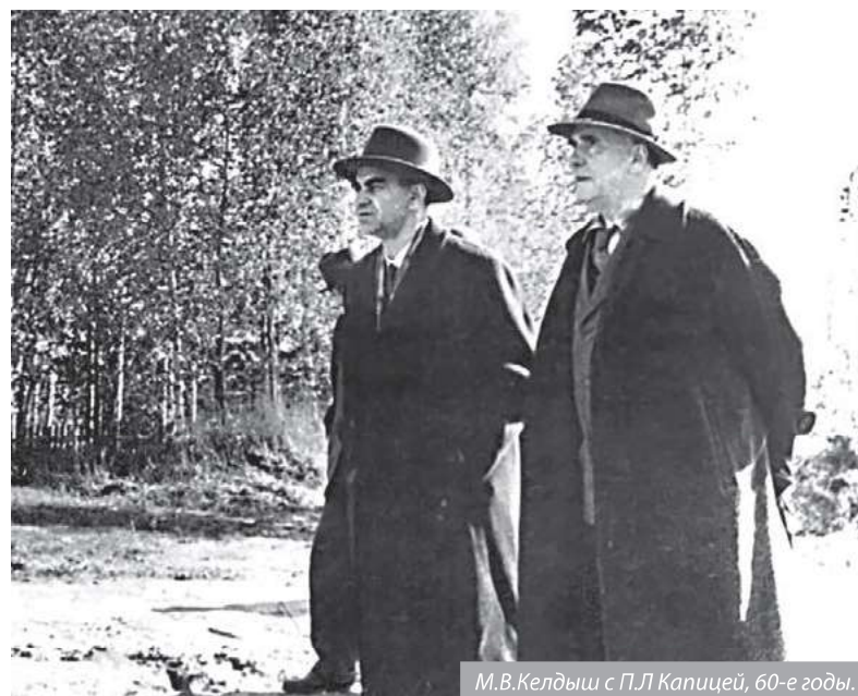
М.В.Келдыш с П.Л.Капицей, 60-е годы.