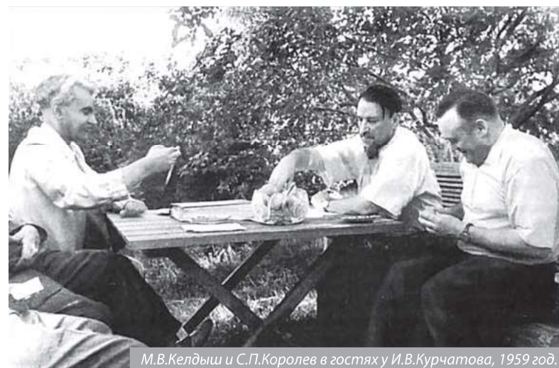
М.В.Келдыш и С.П.Королев в гостях у И.В.Курчатова, 1959 год.